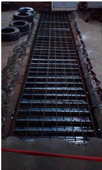
Армирование монолита плиты