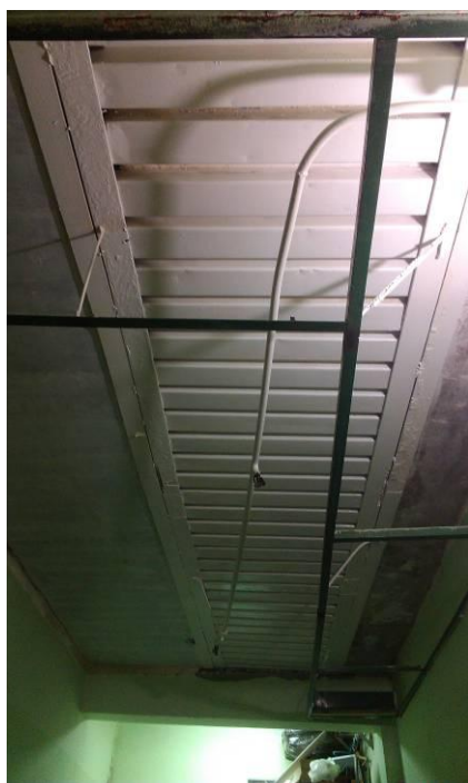
Вид снизу готовой заливки