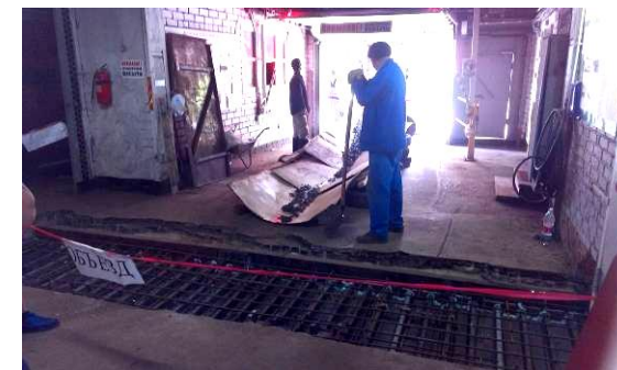
Бетонирование плиты подрядчиком