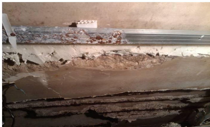
Расслоение плиты, обрушение потолка, гниение арматуры из за протекания