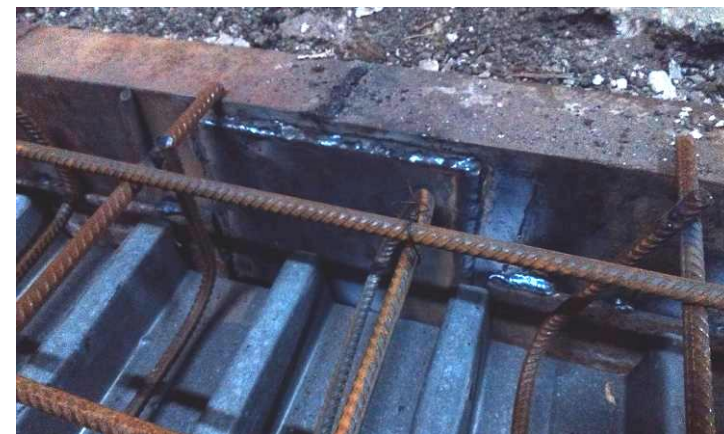
Демонтаж обломков и сварка арматуры с каркасом из несъемной опалубки